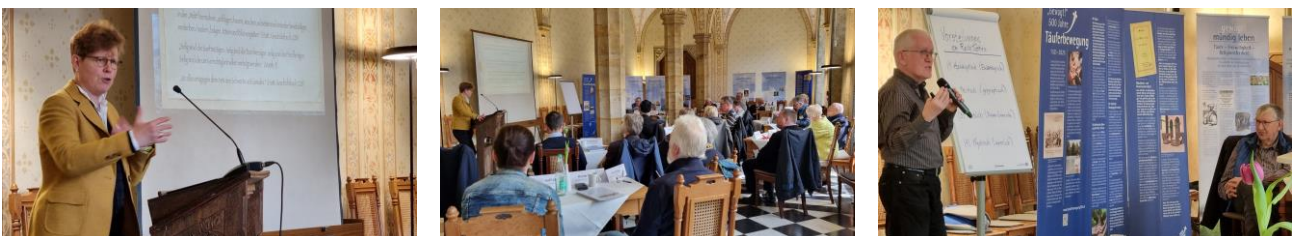
Fotos von der Delegiertenversammlung im Kloster Loccum