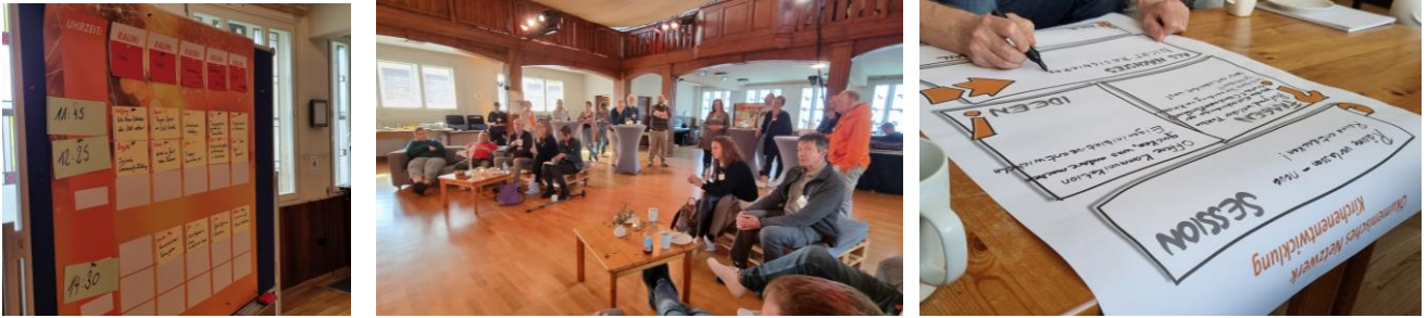
Eindrücke vom „Barcamp für Neues in Kirche“ in Osnabrück