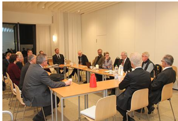
Vorstand der ACKN im Gottesdienst bei der und im Gespräch mit der NAK Gemeinde Hannover-Süd, 07. November 2018 in Hannover